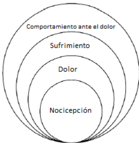
Figura 1.- Modelo de Loeser.

El hecho de que no se pueda detectar una causa física, no significa que tu dolor no sea real. El dolor de hecho, no es solo un proceso corporal. Es cierto que el dolor tiene un componente físico (corporal), ya que receptores en nuestros cuerpos pueden capturar señales y producir mensajes de peligro. A través del sistema nervioso, estos mensajes son transportados al cerebro, donde las señales son interpretadas y procesadas. Durante este proceso, los recuerdos y las expectativas jugarán un rol importante, lo que son considerados los aspectos psicológicos del dolor. Es debido a estos componentes en el cerebro que esas señales pueden ser percibidas como dolor. Este mecanismo está ilustrado en la figura de abajo (modelo de dolor de Loeser).